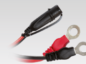
Connecteur cosse 45 cm - M6 029194