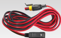
Rallonge 2.5 m - 029057