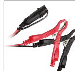
Pinces (45 cm)