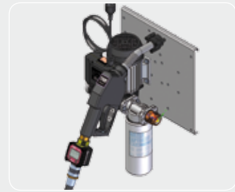
ST Panther72 Filter + K24 meter