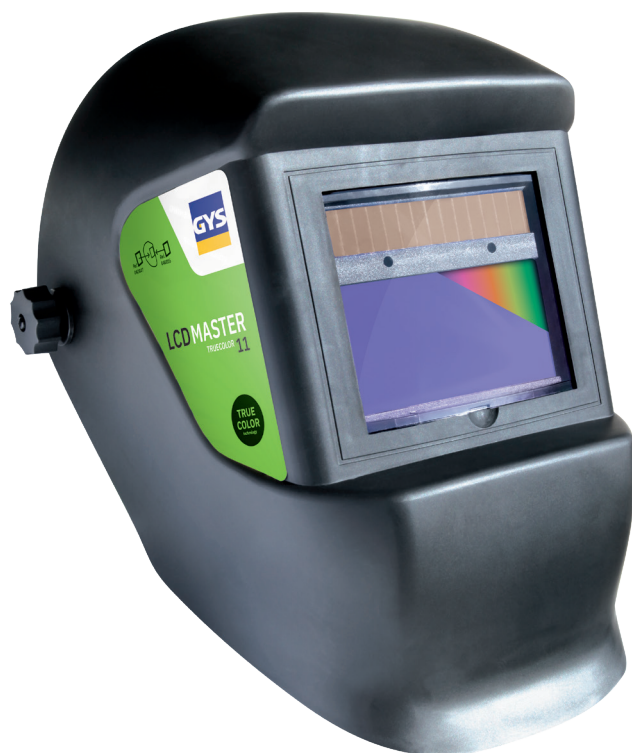
Livré avec un serre-tête