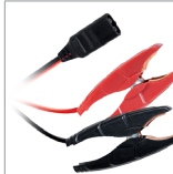
Pinces (35 cm)